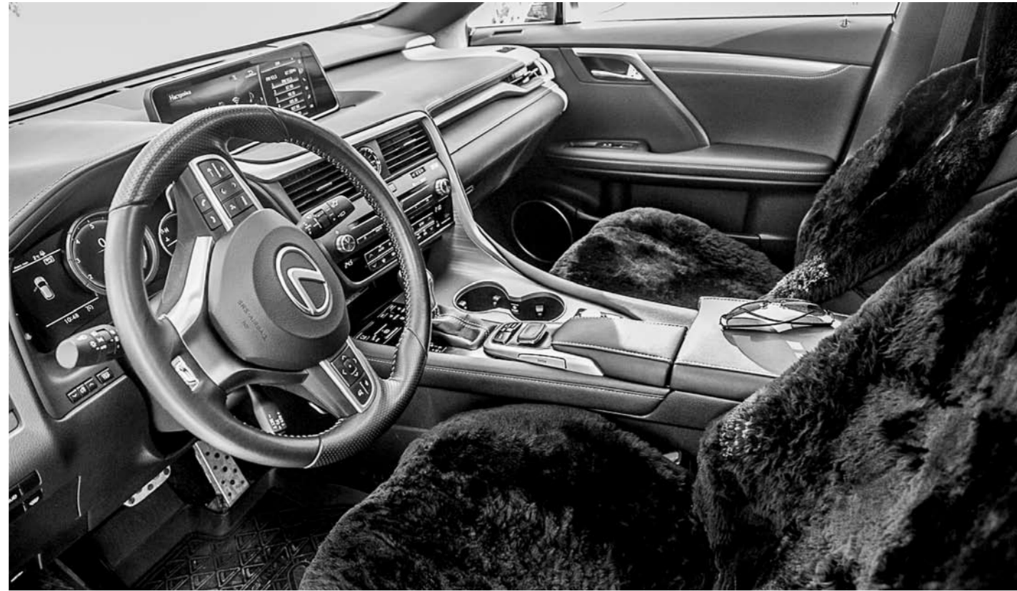
Новый Lexus RX с 3,5-литровым двигателем – это, конечно, просто космос. Драйв – сумасшедший! Интерьеры – царские! В общем, дорого-богато в лучшем виде.

обесе: корпус зеркал заднего вида черный вне зависимости от цвета кузова, радиаторная решетка пестрит ячейками, а не горизонтальными полосами обычных версий, задний бампер снизу подчеркивает индивидуальную хромированную накладку.