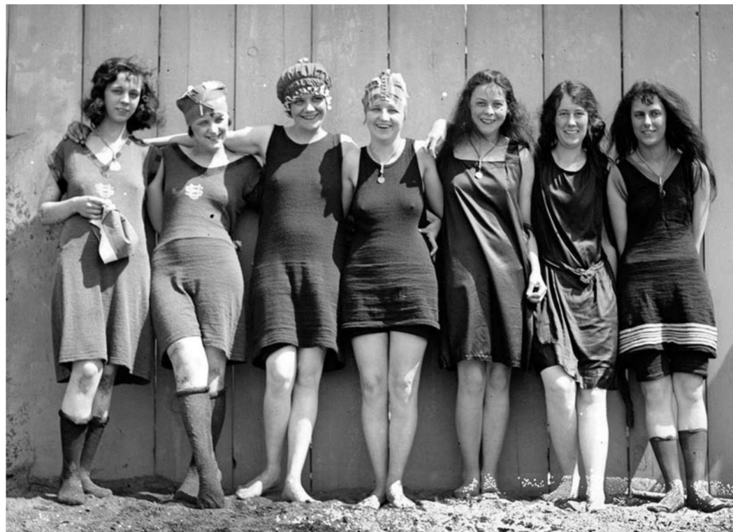
На прошлой неделе женщины, прямо скажем, отличились.

Ростовардейцы задержали пожилую местную жительницу, которая попыталась похитить из магазина деньги, хранившиеся в металлическом сейфе, и монитор