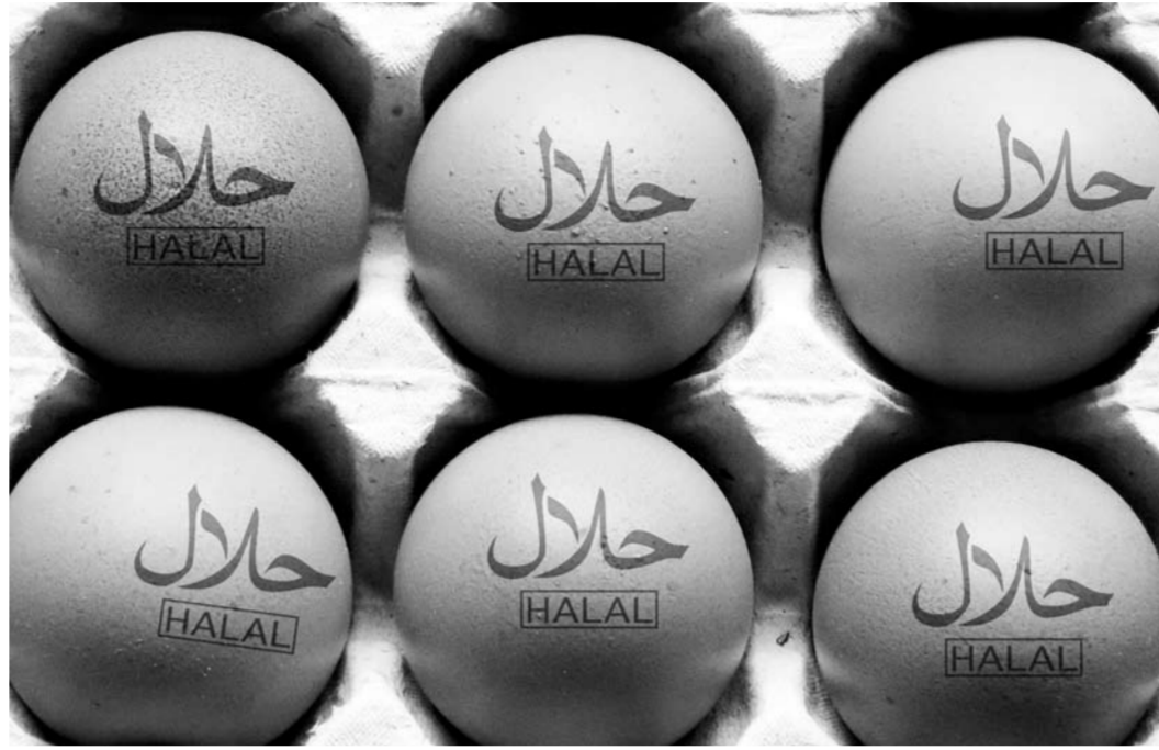
Халяльные продукты можно приобрести во всех крупных гипермаркетах. Отдельных полок для нее нет, но найти их среди других по маркировке на упаковке совсем не сложно.

можно купить в обычных супермаркетах. Во-первых, все, что растет, – разрешено, то есть овощи и фрукты можно есть любые. Во-вторых, рыба, если у нее есть плавники и чешуя, тоже считается кошерной. Вопросы начинаются с обработанными продуктами. Но тут все решают списки: заходишь на сайт, смотришь и выбираешь. Напри-