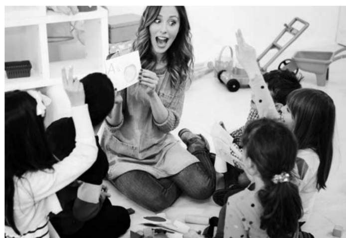
■ При небольшой занятости услуги няни обойдутся в 170 рублей за час, а при полном рабочем дне – 150 рублей час. Правда, чтобы вам помогли подобрать работника, нужно заключить с агентством договор.

Для надежности вы можете обратиться в агентство по подбору домашнего штата. Например, «Радуга» проводит обучение специалистов семейного персонала и имеет большую базу квалифицированных нянь. При небольшой занятости услуги няни обойдут-