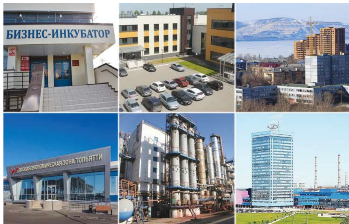
Бизнес-инкубатор, «Жигулевская долина», «Тольяттисинтез», ОЭЗ, TOP, «Индустриальный парк» – в нашем городе успешно работают площадки, которые привлекают новые инвестиции и создают рабочие места.

фонией. Все это создает комфортную, обустроенную площадку с инфраструктурой, которой могут пользоваться компании-резиденты. Они на льготных условиях получают полностью оборудованное рабочее пространство, телефонную линию и отсутствие расходов на коммунальные