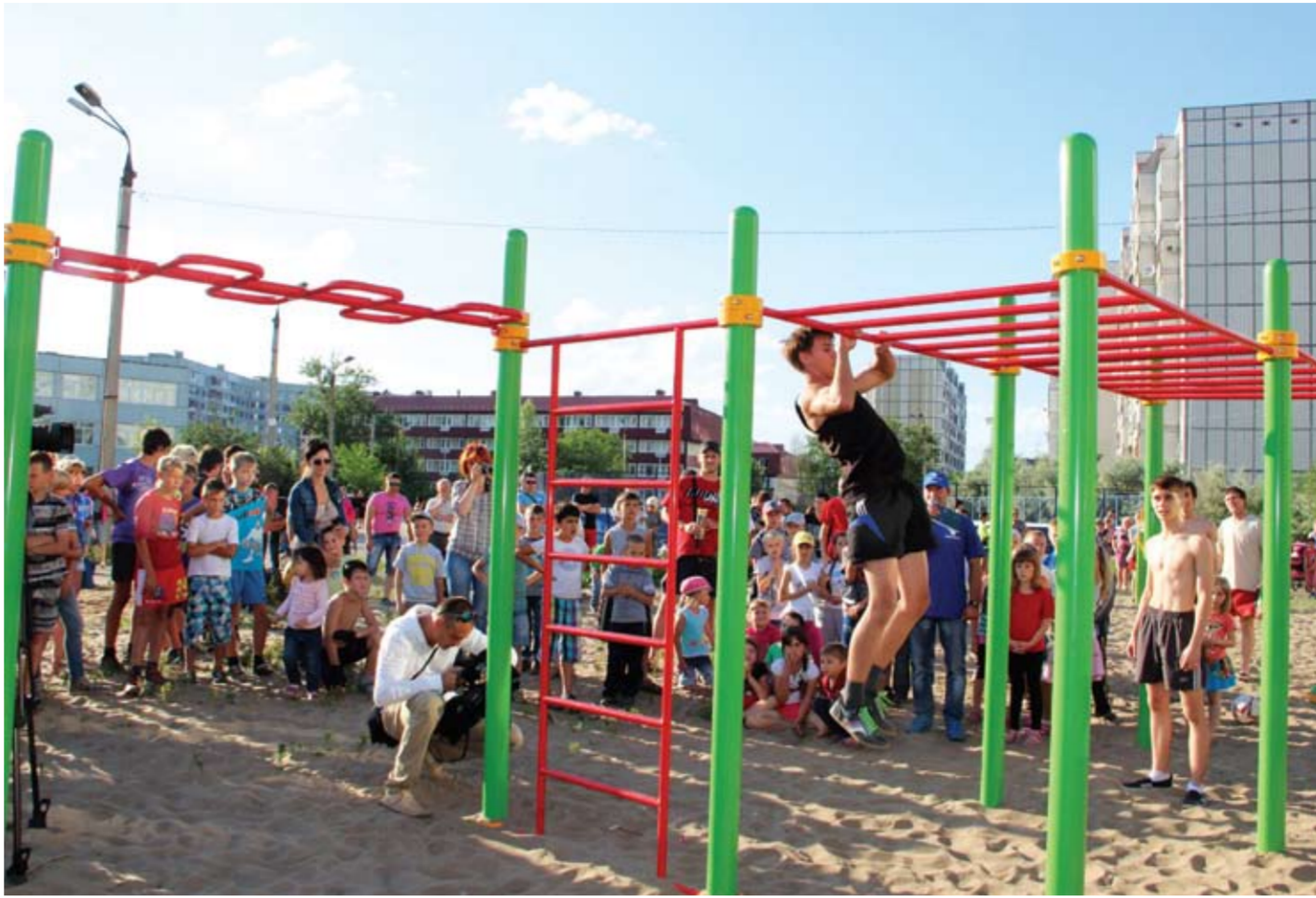
Представители предприятия смогли решить вопрос с обустройством детских площадок и добиться существенной экономии городского бюджета на благоустройстве (установка детских городков и спортивных площадок), выбрав в качестве партнера местного производителя.

Взаимодействуя с общественным советом и депутатами Комсомольского района, представители предприятия смогли решить вопрос с обустройством детских площадок и добиться существенной экономии городского бюджета на благоустройстве (установка детских городков и спортивных площадок), выбрав в качестве партнера местного производителя – «Атрикс». Выбор был не случайный. Местная компания платит налоги в городской бюджет, обеспечивает горожан работой и предлагает на рынке качественную продукцию. На «КуйбышевАзоте» понимают, что выстраивать конструктивный диалог с бизнесом можно и нужно, внося свой вклад в благоустройство дворовых территорий.