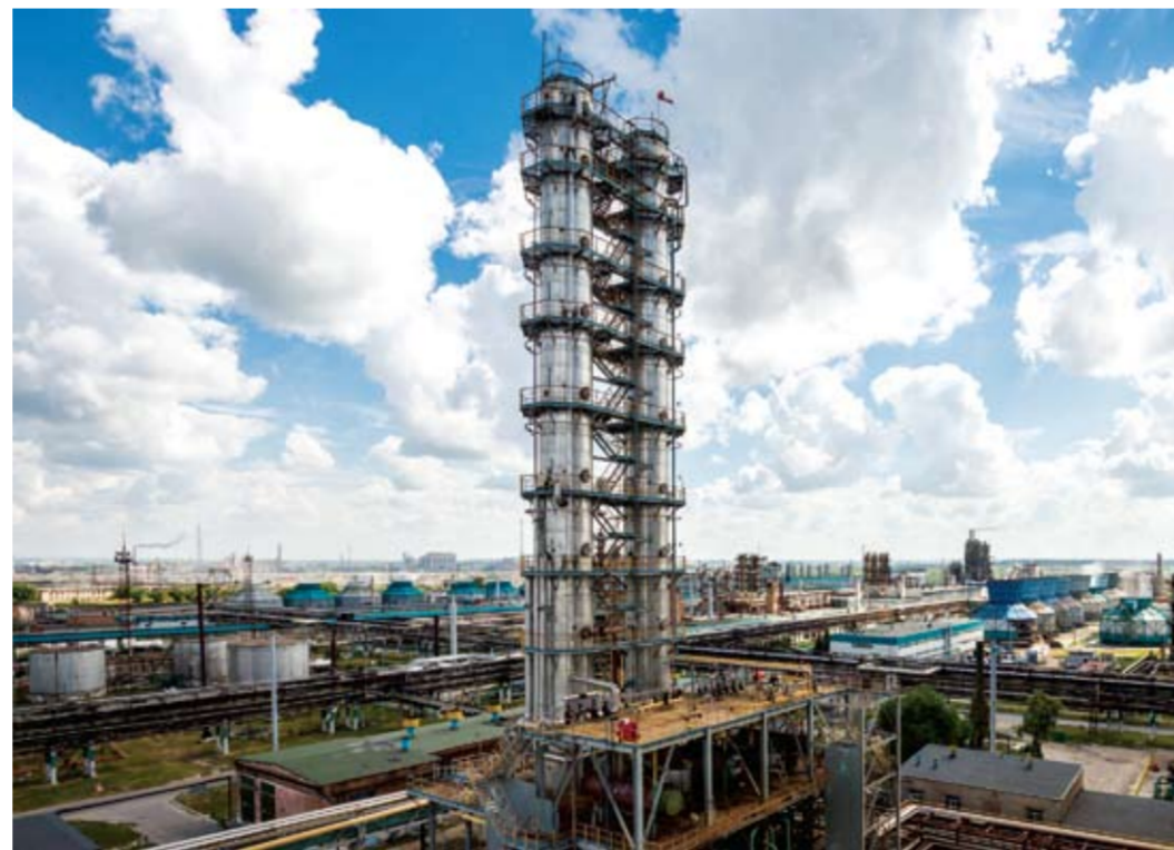
ООО «СИБУР Тольятти» – одно из крупнейших в России предприятий по производству синтетических каучуков, мономеров, фракций и высокооктановых компонентов к бензину.

маслонаполненного каучука эмульсионной полимеризации СКМС-30 АРКМ-27. Новая марка позволит получать улучшенные прочностные характеристики конечных изделий – автомобильных покрышек, резинотехнических изделий.