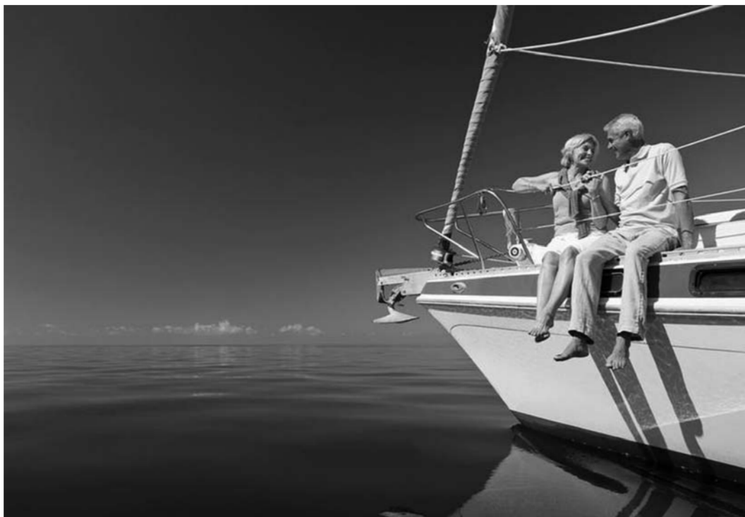
Имущество состоятельных банкротов оформлено на членов семьи или передано по договору дарения. Скорее всего уровень жизни этих людей после банкротства не сильно изменился.