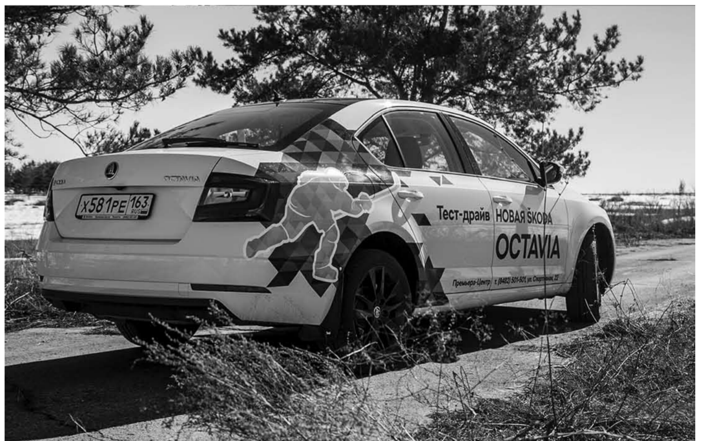
Skoda толсто намекает на то, что теперь Octavia не только семейный автомобиль, но и седан, на котором не стыдно подъехать к головному офису вашего ведущего контрагента.