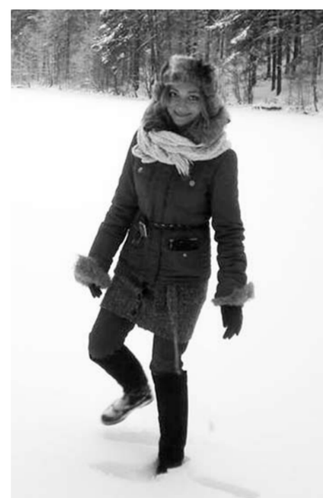
С русскими приятно работать, вы очень дружелюбные. В Польше тяжело найти друга на работе, потому что каждый озабочен карьерой. Здесь же единый коллектив, все встречается даже в свободное время.

С русскими вообще приятно работать, вы очень дружелюбные. В Польше тяжело найти друга на работе, потому что каждый озабочен карьерой. Здесь же единый коллектив, все встречается даже в свободное время. Я до сих пор общаюсь с некоторыми коллегами. Правда, работают в России медленнее. У людей есть время