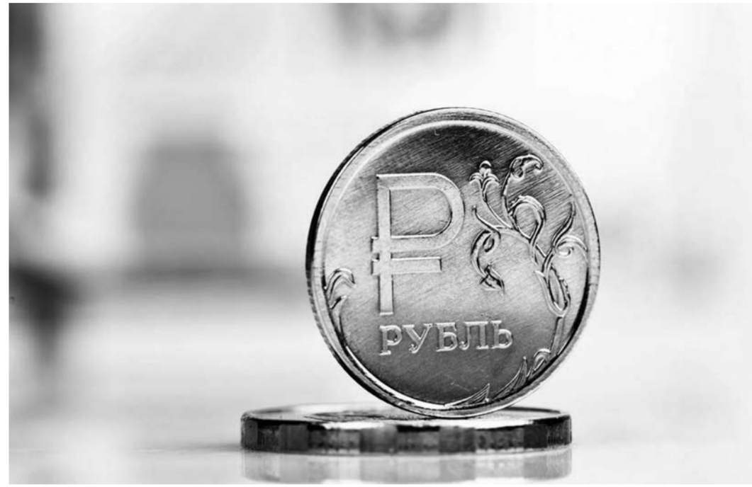
Состоятельные россияне, внимательно следящие за политикой государства, уже давно утратили веру в крепкий рубль и хранят свои сбережения в валюте, заявляет глава ВТБ24 Михаил Задорнов.

При стабильном рубле его реальный эффективный курс вырастет на 6,6 и 5,3% в ближайшие два года. При ослаблении же национальной валюты в