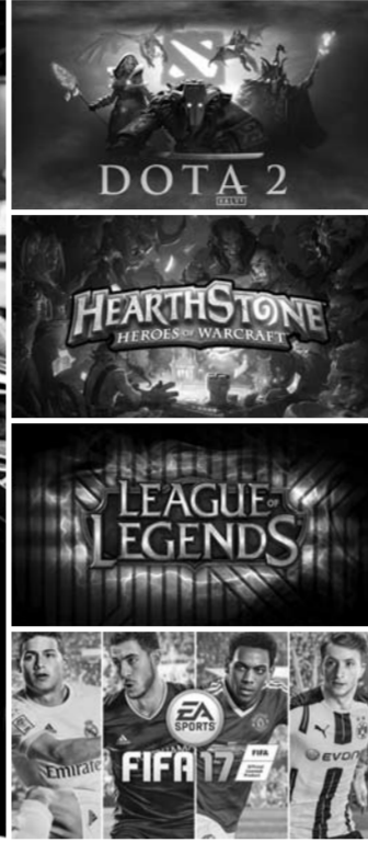
В этом году соревнования пройдут по четырем видам программы: Dota 2, League of Legends, FIFA 17 и Hearthstone. Общий призовой фонд составит 7 млн рублей: 3,2 млн рублей – в Dota 2, 2,5 млн в League of Legends и по 650 тыс. в FIFA и Hearthstone.

Главный источник денег в киберспорте – крупные бренды. В основном это сами издатели игр. Они организуют большинство турниров и содержат киберспортивные команды. Это помогает им продвигать свои продукты среди обычных геймеров и удерживать много-