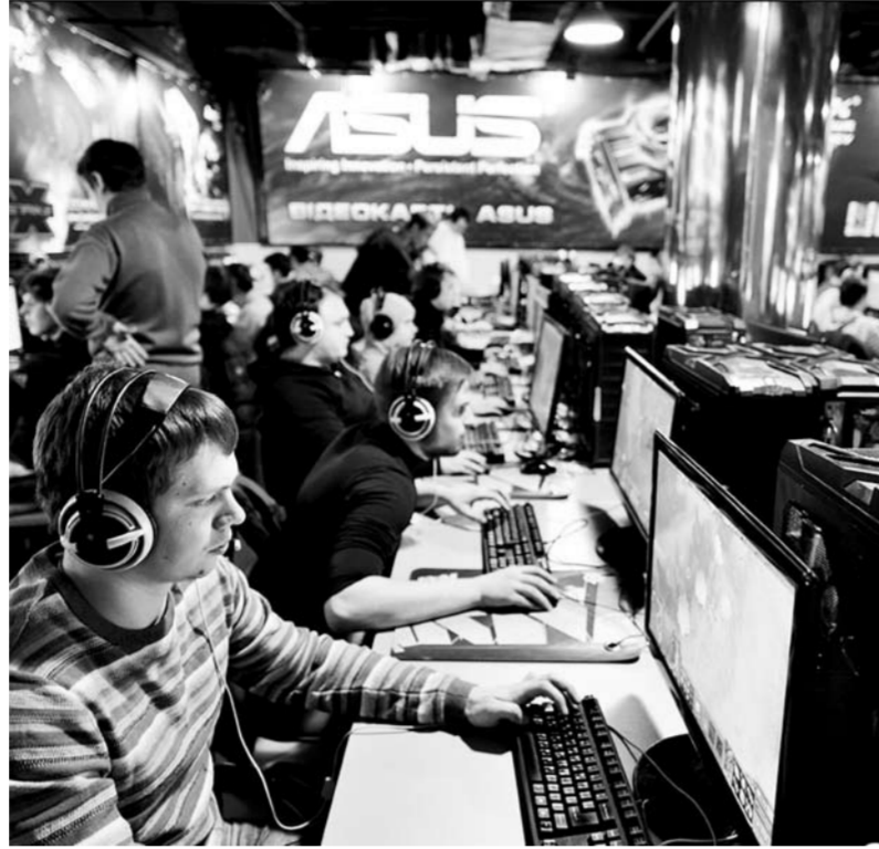
В этом году соревнования пройдут по четырем видам программы: Dota 2, League of Legends, FIFA 17 и Hearthstone. Общий призовой фонд составит 7 млн рублей: 3,2 млн рублей – в Dota 2, 2,5 млн в League of Legends и по 650 тыс. в FIFA и Hearthstone.

Киберспортсмены совсем не бледные ботаники, которые пытаются заменить реальную жизнь виртуальной, а молодые перспективные ребята, которые зарабатывают на том, что действительно любят: персонально