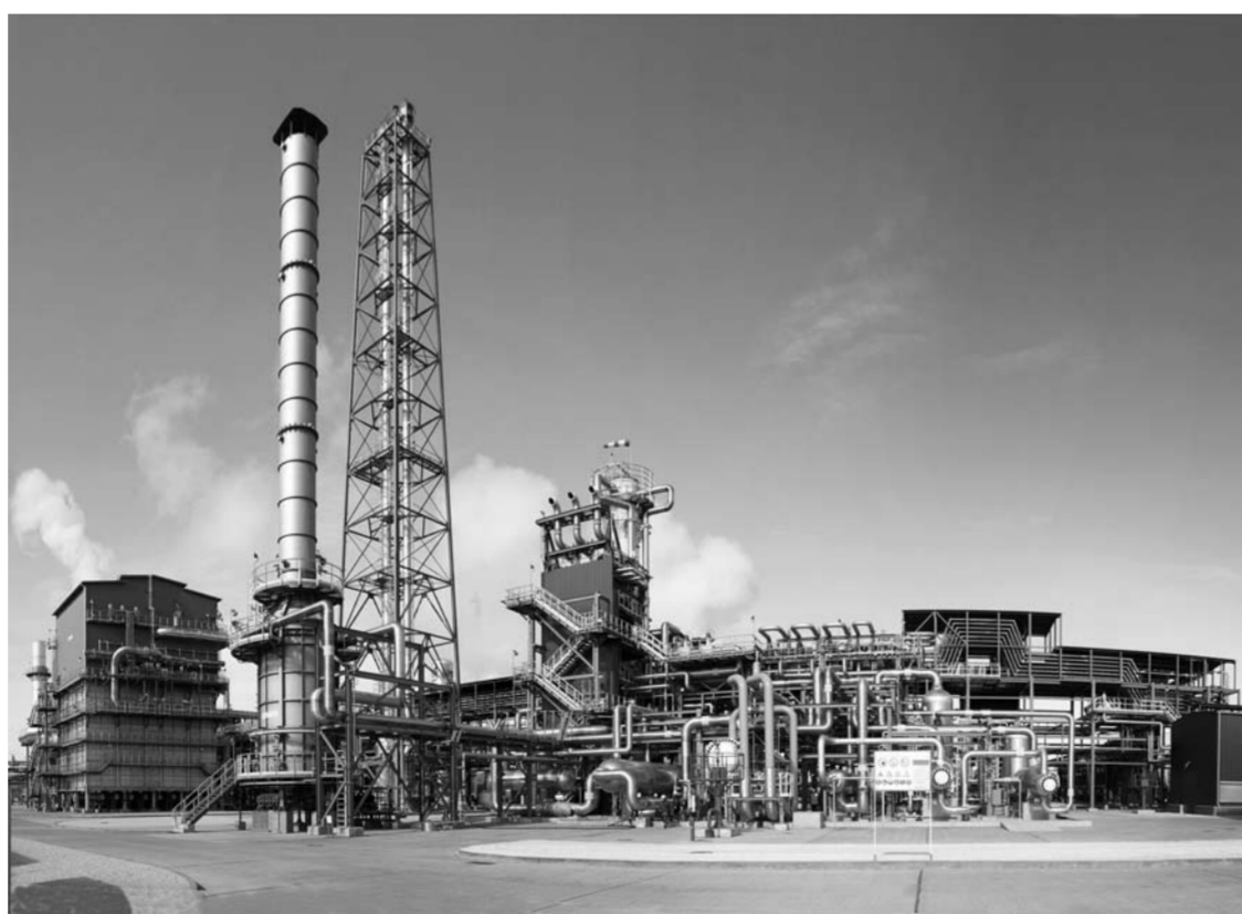
ПАО «КуйбышевАзот» по итогам 2016 года было признано рейтинговым агентством «Интерфакс-ЭРА» лидером экологической прозрачности в химической промышленности.

Все мероприятия в части развития производства, каждая модернизация или реконструкция обязательно рассматриваются не только с точки зрения экономической целесообразности, но и с учетом экологического