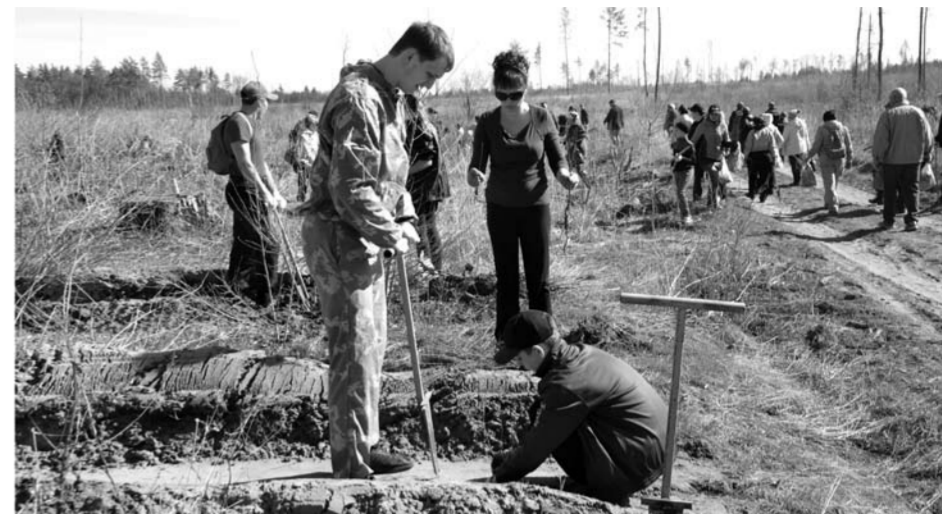
Сотрудники предприятия участвуют в «зеленом десанте» целыми семьями, приводя с собой детей и родственников. Принимая участие в восстановлении леса, люди делают это от чистого сердца.

Лес, пожалуй, ценнейший ресурс Тольятти. Пожары 2010 года уничтожили чуть ли не половину массива и больно ударили по экологии города и качеству жизни горожан. При этом тольяттинцы всеми силами стараются возродить «зеленый квартал». В их ряду и сотрудники ПАО «КуйбышевАзот», предприятия, которое прилагает максимум усилий для восстановления погибшего леса.