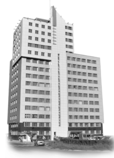
Плаза. Отис. Реклам