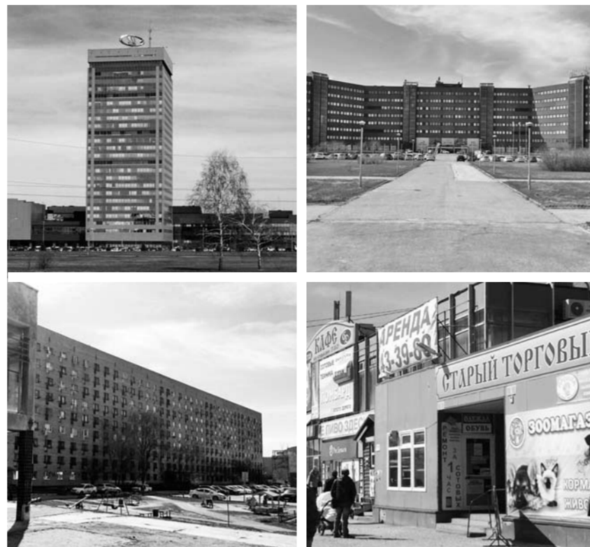
Вы настоящий житель Тольятти, если сможете добраться до места назначения, опираясь на использованные в описании пути слова «шоколадка», «изолента», «Третьяковка» и «Старый торговый».

Место в Центральном районе вдоль улицы Мира между улицей Голосова и ДК «Тольятти» жители называют «поле чудес». Появилось это прозвище в те вре-