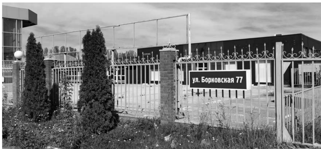
За долги по кредитным договорам ВТБ24 получил земельный участок и здание на улице Борковской, 77, с оборудованием, СТО и покрасочным комплексом.