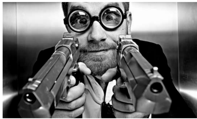
Пейнтбол, лазертаг, различные виды стрельбы из настоящего стрелкового оружия – снять напряжение и зарядиться энергией в Тольятти можно в клубах «Пиф Паф», «13 район», «Ловчий плюс» и других.

лит обратить внимание на лазертаг. Принцип игры тот же, что и в пейнтболе, отличается только оружием. В лазертаге используется оборудование, действие которого основано на работе инфракрасного излучателя и датчиков, расположенных на голове участников. Таким образом, никаких болевых ощущений при ранении не будет, что позво-