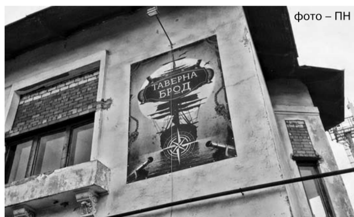
фото – ПН