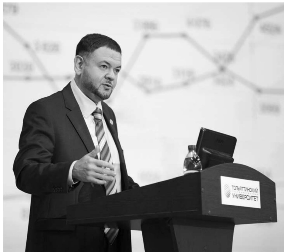
Подывая заявку на конкурс, образовательные учреждения готовили проекты Программы развития. ТГУ представил на конкурс проект Программы развития с четким списком мероприятий.

Во второй волне конкурса на присвоение статуса опорных университетов Минобрнауки РФ условно разделило вузы на две группы. В первую попало восемь вузов, во вторую – 14. Для каждой группы на 2017 год предусмотрен свой объем финансирования из федерального бюджета. Восемь вузов, вошедших в первую группу, получают от Минобрнауки РФ в 2017 году по 100 млн рублей. Вузы из второй группы наряду с финансированием из региональных и иных источников будут профинансированы из федерального