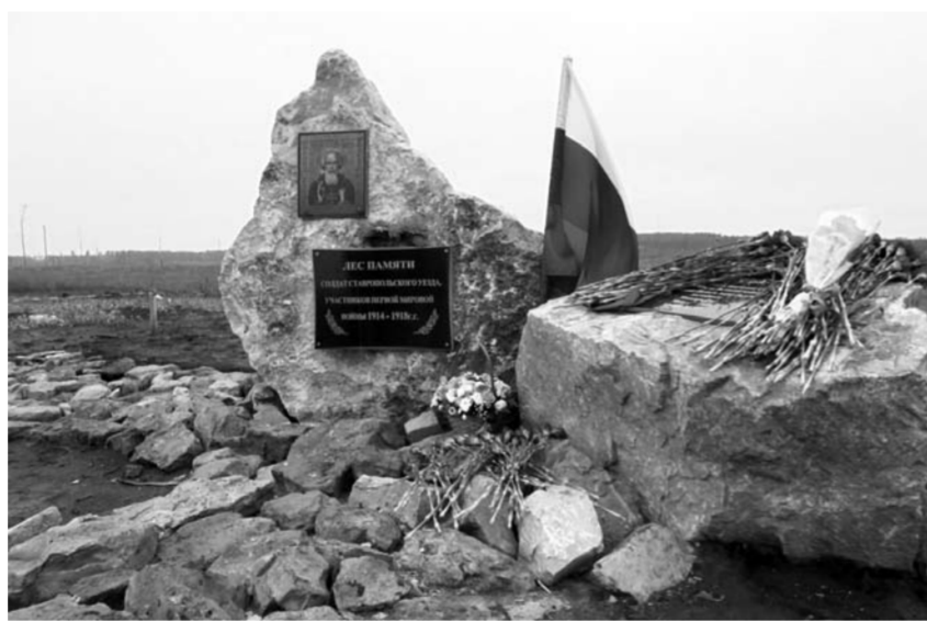
За время реализации проекта было высажено 70 тыс. саженцев. И сегодня на месте пепелища 2010 года начинает жизнь 17 гектаров молодого леса.

Единственный вопрос выездного расширенного заседания Общественной палаты Самарской области был связан с проблемами восстановления, сохранения лесов региона и участием общественности в их разрешении. В ходе заседания была обозначена необходимость создания условий для эффективного взаимодействия органов публичной власти, общественности и населения в вопросах восстановления лесов. В обсуждении реализации данной задачи приняли участие представители министерства лесного хозяйства, охраны окружающей среды и природопользования, муниципальных образований,