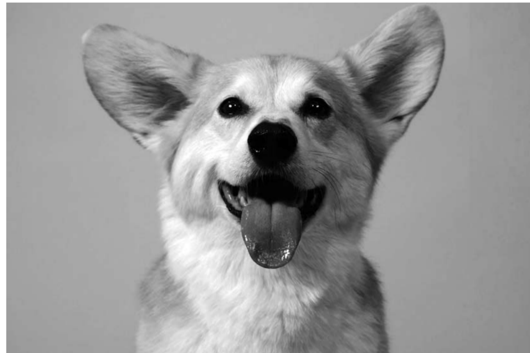
■ Одна британская пенсионерка настолько усердно следила за аппетитом своей собаки породы корги, что ее питомец набрал рекордный вес в 40 кг. Нормальный вес взрослого корги — 12–15 кг.

Возможно, государство все-таки поняло, что «действовать запретами глупо», так как придумало новый способ оградить граждан от нежелательного с точки зрения чиновников контента. Например, в Забайкальском крае начало работу молодежное объединение «Кибердружина», целью которого является борьба с запрещенным интернет-контентом и порнографией. Сообщается, что «дружинники» будут работать в тесном взаимодействии с официальными структурами и пройдут специальное обучение.